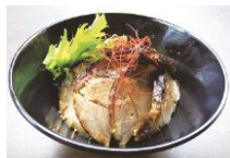
⑳地獄蒸しチャーシュー丼 600円