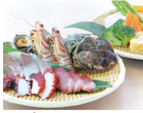
②地獄らおう盛 5,000円 《海鮮お魚+県産野菜》3人前