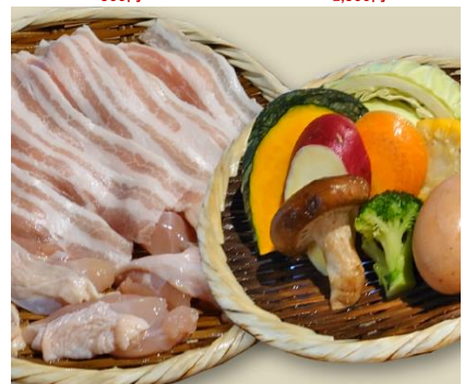
㉝地獄肉盛 1,500円 《牛モモ・鶏モモ+県産野菜》1人前