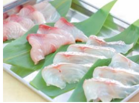
⑤地獄鯛しゃぶ 700円 ⑥地獄鱈しゃぶ 500円