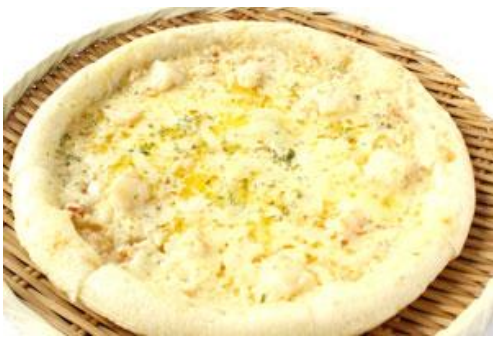
⑬海鮮蒸しピザ 地熱でむした地獄蒸しピザ 1,500円