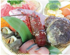
①地獄だいおう盛 10,000円 《海鮮お魚+牛豚・鶏肉+県産野菜》4~5人前