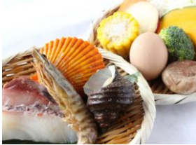
④地獄ご盛 1,500円 《海鮮+県産野菜》1人前