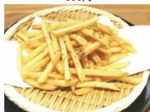
㉖フライドポテト 300円