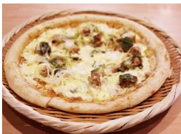
⑭テリヤキチキン蒸しピザ 1,300円