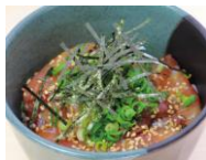
⑲リュウキュウ丼 600円