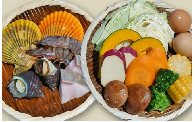
②地獄えんま盛 《海鮮お魚+県産野菜》2人前 地獄蒸しをたっぷり堪能できる一皿です。 3,000円